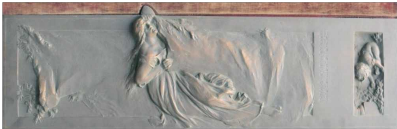
▲ Stanislav Sucharda, Poklad (výjev z Kytice K. J. Erbena), 1898, patinovaný kov.