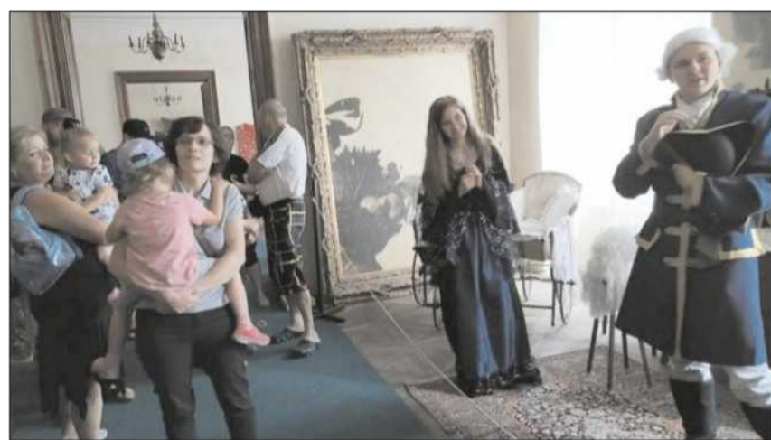
Prodloužený, sváteční víkend můžete využít k návštěvě zámku Stekník. V pondělí 5. července zde budou probíhat i speciální kostymované prohlídky.