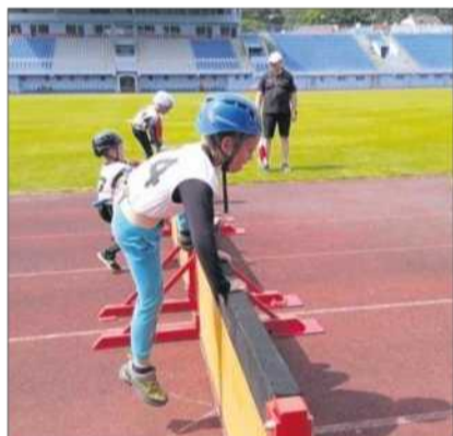
Jedenáct sborů dobrovolných hasičů z Lounska vyslalo své svěřence na první kolo soutěže v hasičském sportu STIMAX CUPu. Na snímku závodnice z Lenešic.