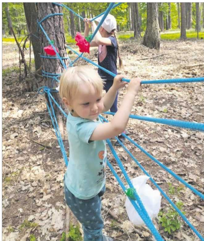
Bezkontaktně a bez občerstvení se letos uskutečnil dětský den v Domoušicích. Zábojovnou lesní procházku s pohádkovými úkoly společně uspořádali mateřská a základní škola a místní hasiči. Start i cíl byl tradičně na fotbalovém hřišti, kde účastníci obdrželi mapku s tajenkou, kterou doplňovali na osmnácti stanovištích. Kvůli pandemii byly letos děti ošizeny o pohádkové bytosti, které celou stezku každoročně doplňovaly. „Děkujeme zhruba osmdesáti dětem, které přišly. Nezoufejte, příští rok snad bude líp,“ vzkazují domoušičtí organizátoři.

Další kolo STIMAX CUPu mladé hasičky čeká v sobotu 28. srpna v Meziboří.