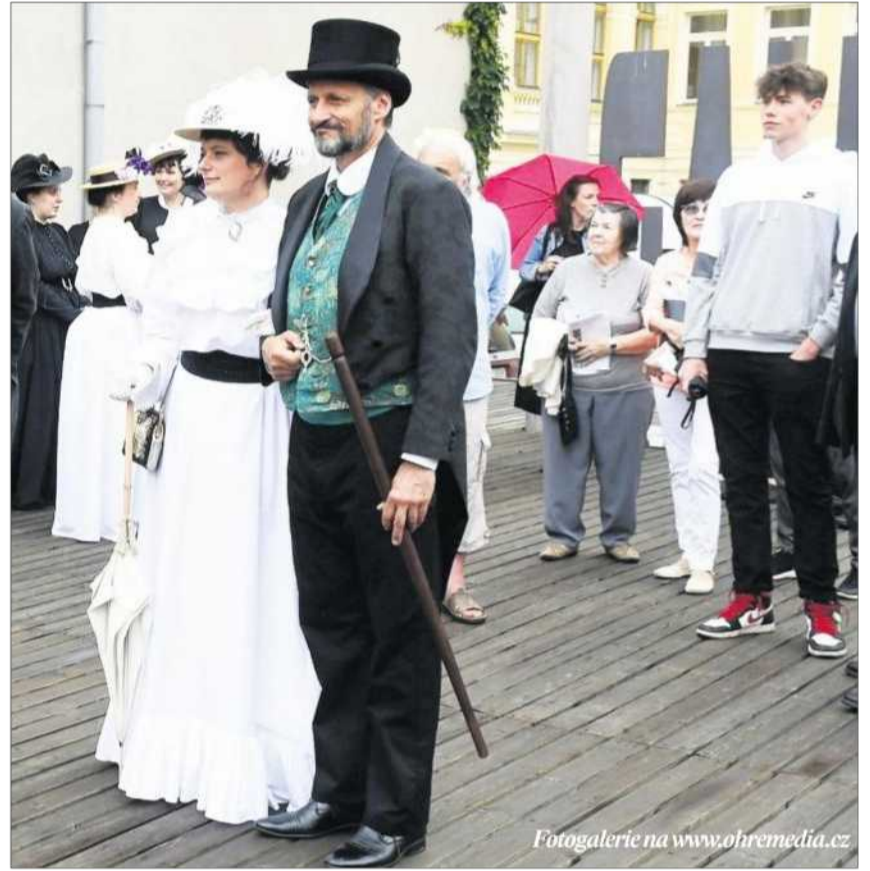
Fotogalerie na www.ohremedia.cz